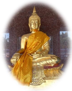
พระพุทธรูปสิงหนมคล