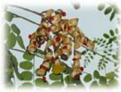
มะกล่ำต้น