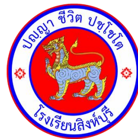
รูปสิงห์ในวงกลม